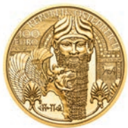
Das Gold Mesopotamiens