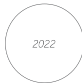
Das Gold der Skythen