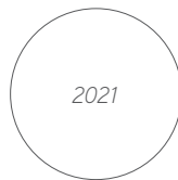
Der Goldschatz der Inka