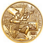
Das Gold der Pharaonen